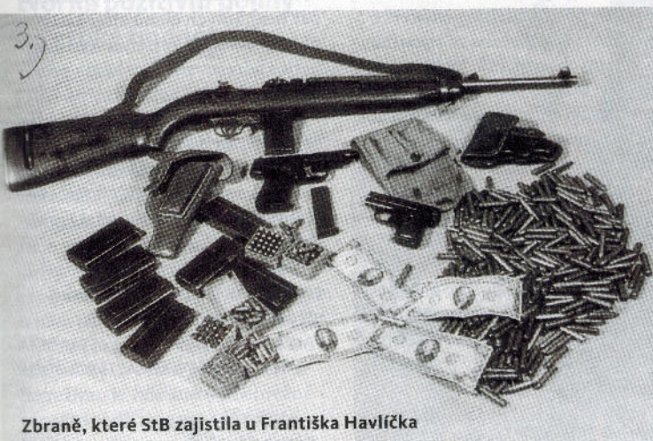
Zbraně, které StB zajistila u Františka Havlíčka